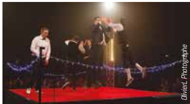
Olivier L. Photographie