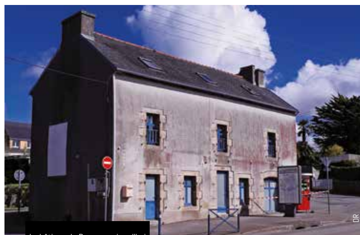
La bâtisse du Douvez, aujourd'hui