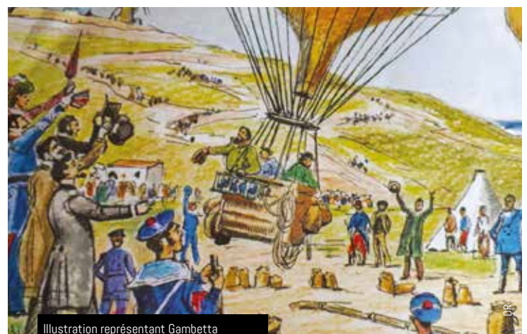
Illustration représentant Gambetta s'échappant en ballon de Paris assiégé