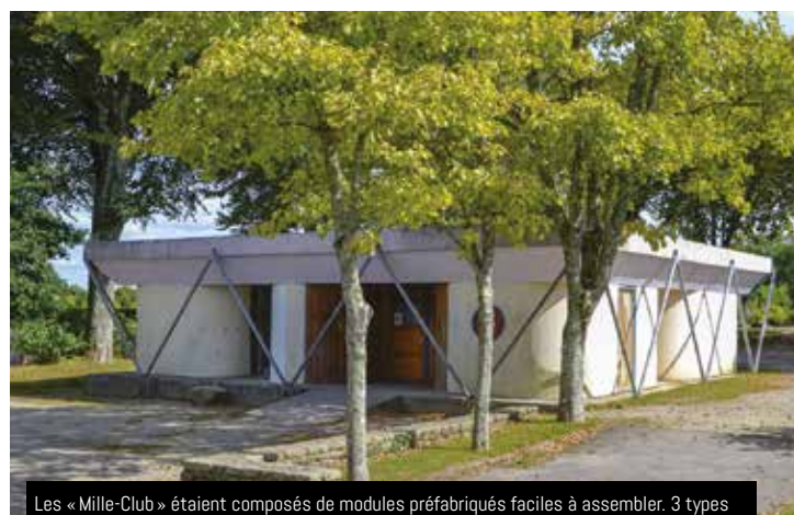
Les « Mille-Club » étaient composés de modules préfabriqués faciles à assembler. 3 types de modules ont vu le jour entre 1967 et 1972 : le modèle SEAL, BSM (ci-dessus) et SCAC