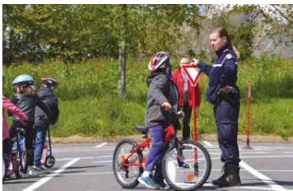
La philosophie qui encadre le PEL s'articule autour du fait de bien grandir et de devenir citoyen. Ici, un atelier sécurité routière à Coataudon en avril 2015