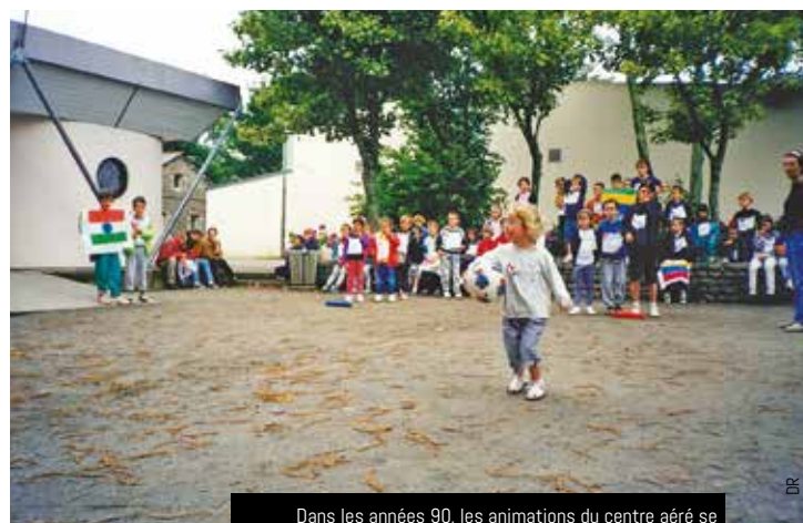
Dans les années 90, les animations du centre aéré se déroulaient au « Mille-Club » et dans les salles aux alentours

les assistantes maternelles de la ronde se réunissent tous les matins au « Mille-Club » où elles font pratiquer aux enfants de 6 mois à 3 ans des activités telles que le chant, la musique, la motricité, etc.