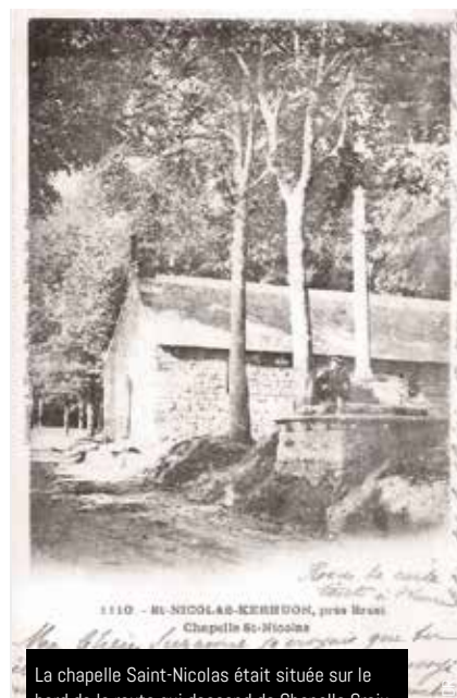
La chapelle Saint-Nicolas était située sur le bord de la route qui descend de Chapelle Croix à la Maison blanche. Le calvaire est toujours là

et plus exactement le 22 novembre, la vieille chapelle Saint-Nicolas (XVI e ) est incendiée par les Allemands qui occupaient la « pyro »