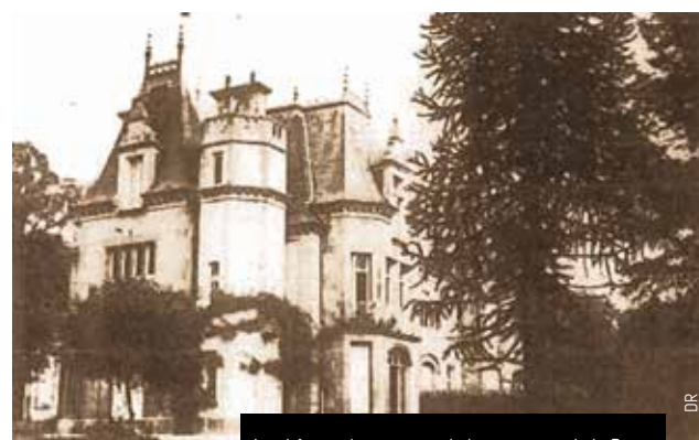
Le château du comte et de la comtesse de la Poype