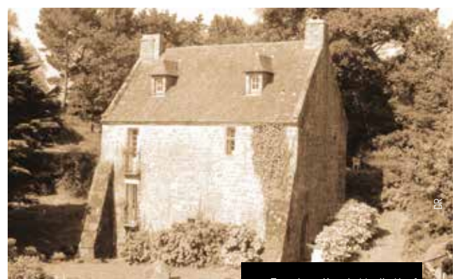
Façade arrière du Moulin Neuf