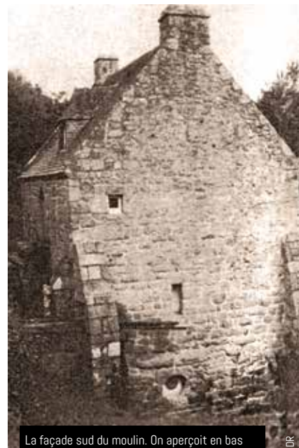
La façade sud du moulin. On aperçoit en bas l'emplacement de l'ancienne roue à aubes

la belle propriété du Moulin Neuf est acquise par un pilote de ligne