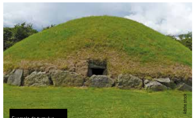
Exemple de tumulus

destruction du blockhaus et montage, sur le site du tumulus, de la serre du groupe d'intérêt économique (GIE) la Croix qui abritera un élevage de bourdons pollinisateurs et d'insectes prédateurs des parasites des plants de tomates Savéol