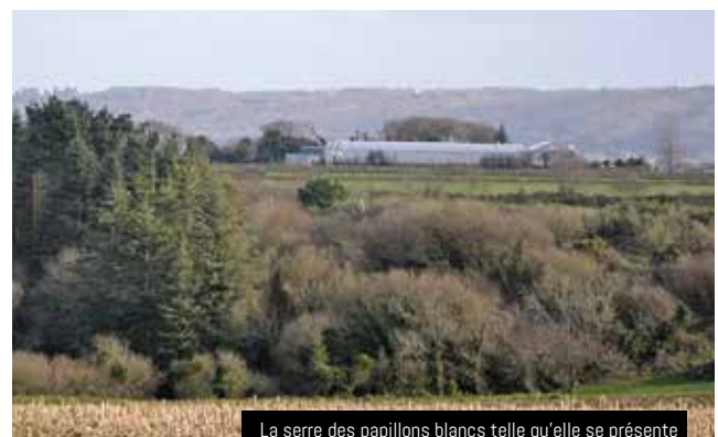
La serre des papillons blancs telle qu'elle se présente aujourd'hui à l'emplacement du tumulus