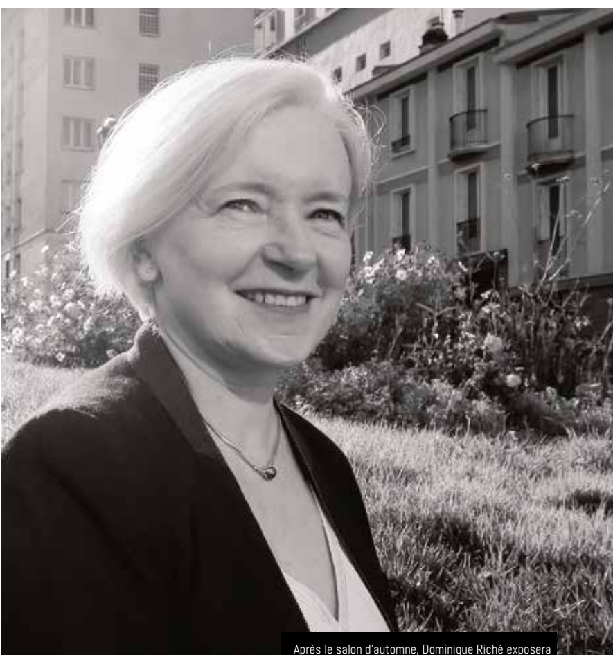
Après le salon d'automne, Dominique Riché exposera ses œuvres à l'Alizé jusqu'au 22 décembre