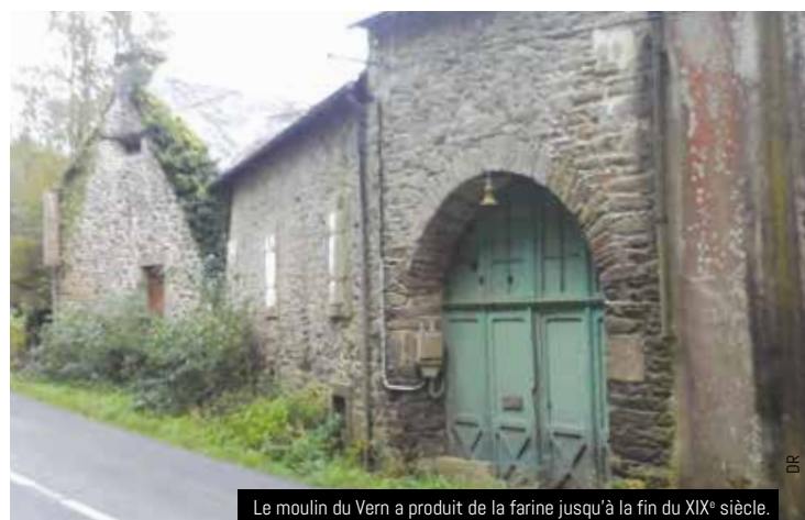
Le moulin du Vern a produit de la farine jusqu'à la fin du XIX e siècle. C'était alors l'un des plus importants du Finistère