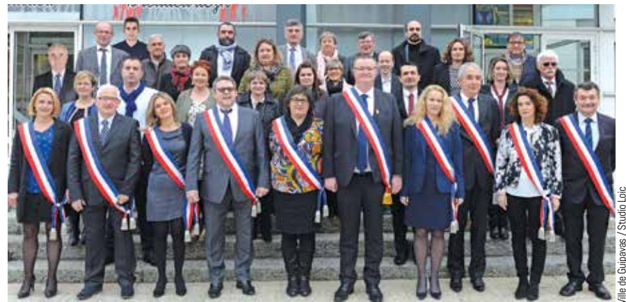
Ville de Guipavas / Studio Linc