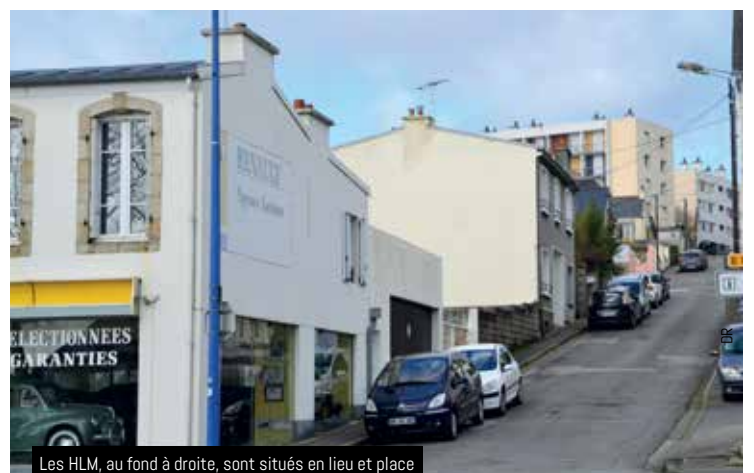
Les HLM, au fond à droite, sont situés en lieu et place des anciens haras, en haut de l'allée des écuyers