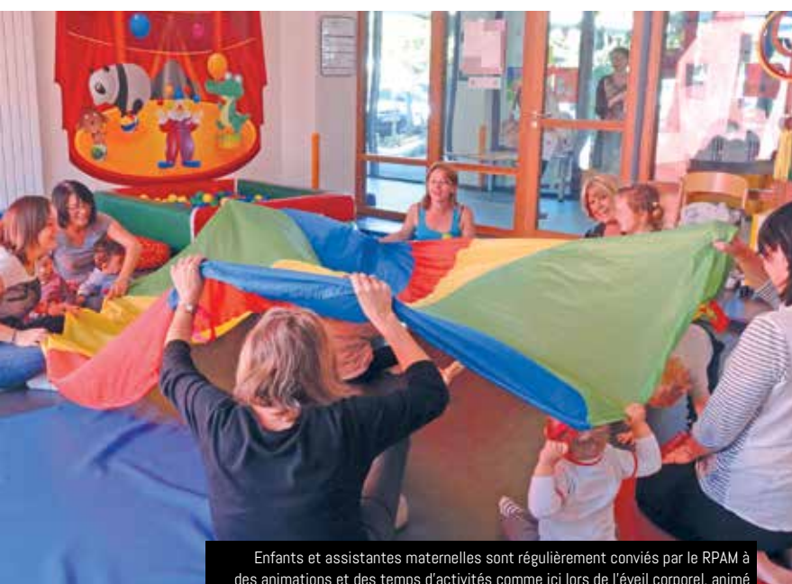
Enfants et assistantes maternelles sont régulièrement conviés par le RPAM à des animations et des temps d'activités comme ici lors de l'éveil corporel, animé conjointement avec le service action éducative jeunesse, à la Maison de l'enfance

Très (trop !) vite après la naissance, bébé grandit et le spectre de la reprise d'activité professionnelle ressurgit, accompagné de cette cruciale question : quel mode de garde faut-il choisir ? Si plusieurs solutions sont envisageables, il reste alors à faire le bon choix et ceci, avant même que l'enfant arrive. Pour les aider face à cette situation, les parents qui le souhaitent peuvent se rapprocher du relais parents assistantes maternelles (RPAM) de Guipavas. Ils y trouveront également de nombreuses informations utiles.