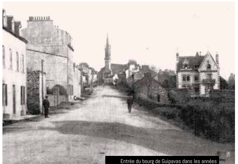
Entrée du bourg de Guipavas dans les années 1920 / 1930. La Villa Pen-ar-Valy est sur la droite

La Villa de Pen-ar-Valy devient la résidence de Kerastel