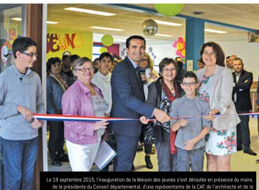
Le 19 septembre 2015, l'inauguration de la Maison des jeunes s'est déroulée en présence du maire, de la présidente du Conseil départemental, d'une représentante de la CAF, de l'architecte et de la députée de la circonscription. Le ruban était confié à des membres de la commission jeunesse

La Maison des jeunes (MDJ), ouverte en 1992, a connu (tout comme sa fréquentation et son public) une évolution importante au fil des années. Le bâtiment, qui vient de bénéficier d'une restructuration, a été inauguré en septembre dernier. Cela marque une nouvelle étape pour cet équipement à vocation éducative. Par le biais du loisir collectif, la MDJ participe à la construction identitaire, la coéducation et à l'épanouissement des enfants et des jeunes qu'elle accueille.