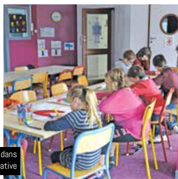
L'espace 6-9 ans a été aménagé dans l'ancienne crèche associative