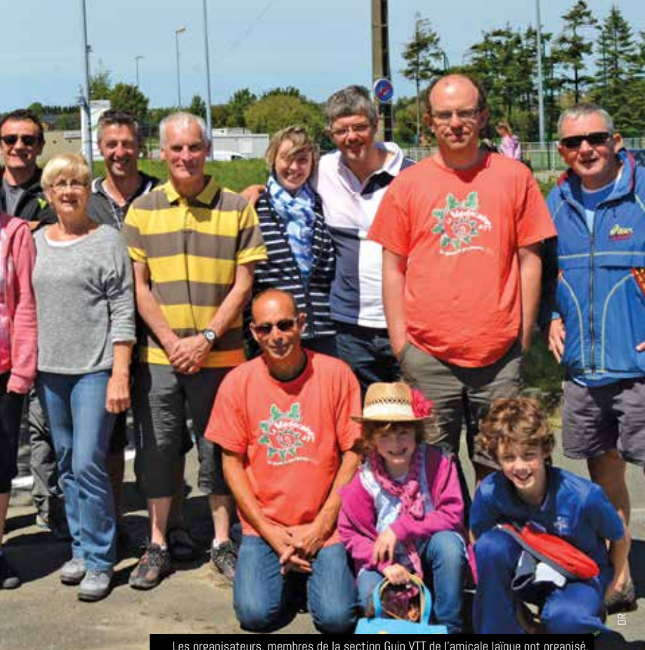
Les organisateurs, membres de la section Guip VTT de l'amicale laïque ont organisé, le 7 juin dernier, une randonnée qui a rassemblé près de 300 sportifs