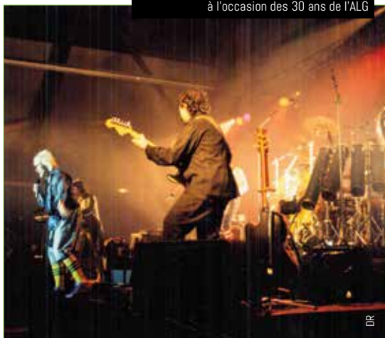
Concert de Tri Yann en 1995 à Kerlaurent à l'occasion des 30 ans de l'ALG