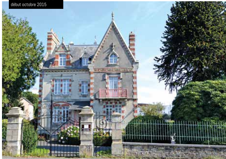
La résidence de Kerastel début octobre 2015