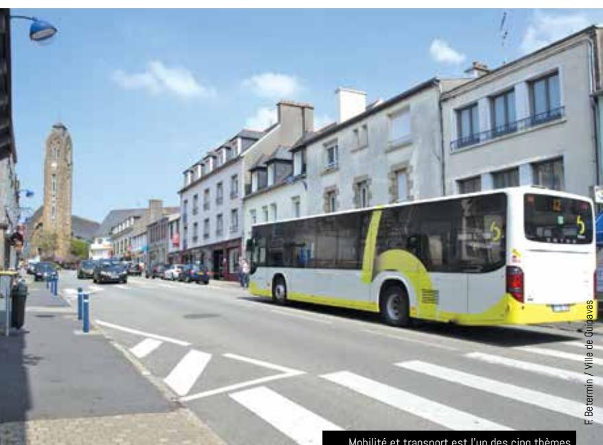
Mobilité et transport est l'un des cinq thèmes abordés dans le Climat Déclic

POUR PARTICIPER ET S'INFORMER WWW.LECLIMATDECLIC.BREST.FR