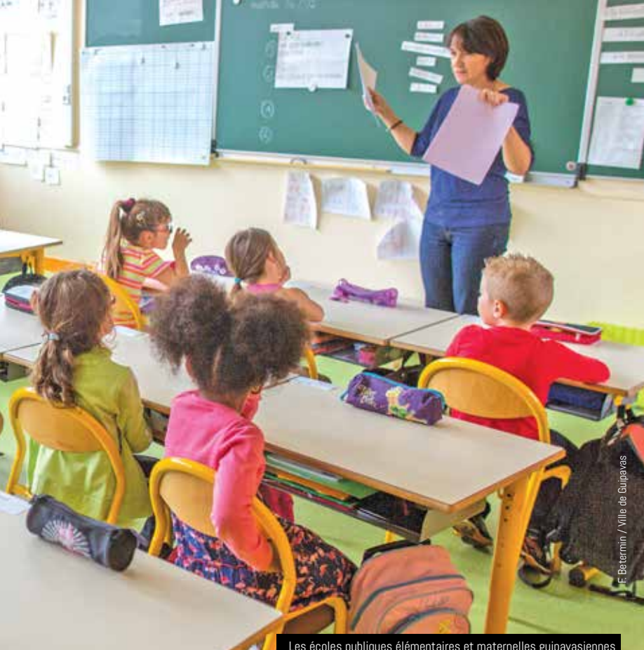
Les écoles publiques élémentaires et maternelles guipavasiennes accueillent, en cette rentrée 2015, 974 enfants