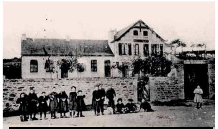
Située rue de Brest, l'école publique des garçons du « bas du bourg » a été ouverte en 1901 pour remplacer celle de la Montagne. Elle abrite depuis 1992, des salles destinées aux associations

l'école de Coataudon est désaffectée. Elle sera transformée en logements en 2005