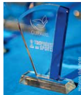
Horizons club photo

Les Trophées du sport 2016 ont été décernés le 7 janvier en prélude à la cérémonie des vœux. 14 clubs locaux ont été mis à l'honneur et 25 récompenses ont été remises soit à des sportifs ayant remporté un titre, soit à des « performeurs » ou encore à des bénévoles associatifs.