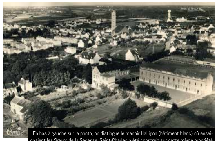
En bas à gauche sur la photo, on distingue le manoir Halligon (bâtiment blanc) où enseignaient les Sœurs de la Sagesse. Saint-Charles a été construit sur cette même propriété